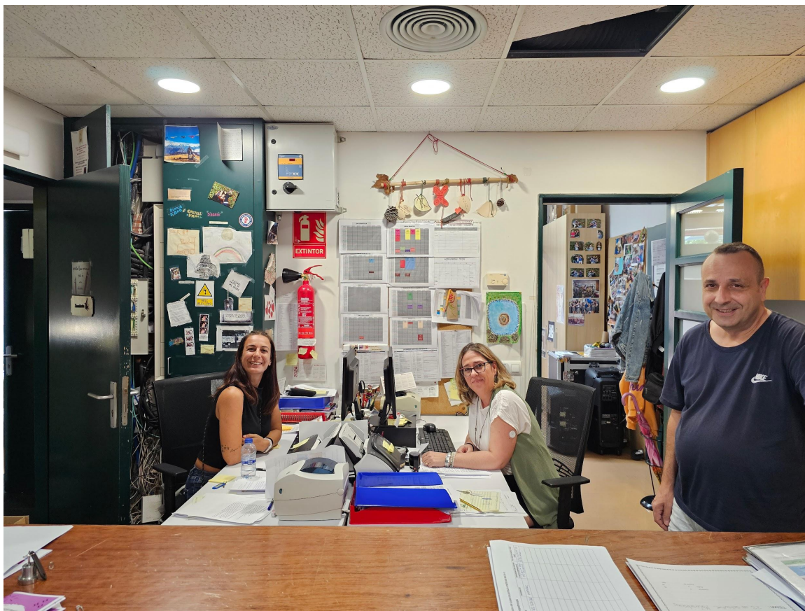
Centre Cívic Vicenç Bou - Platja d'Aro