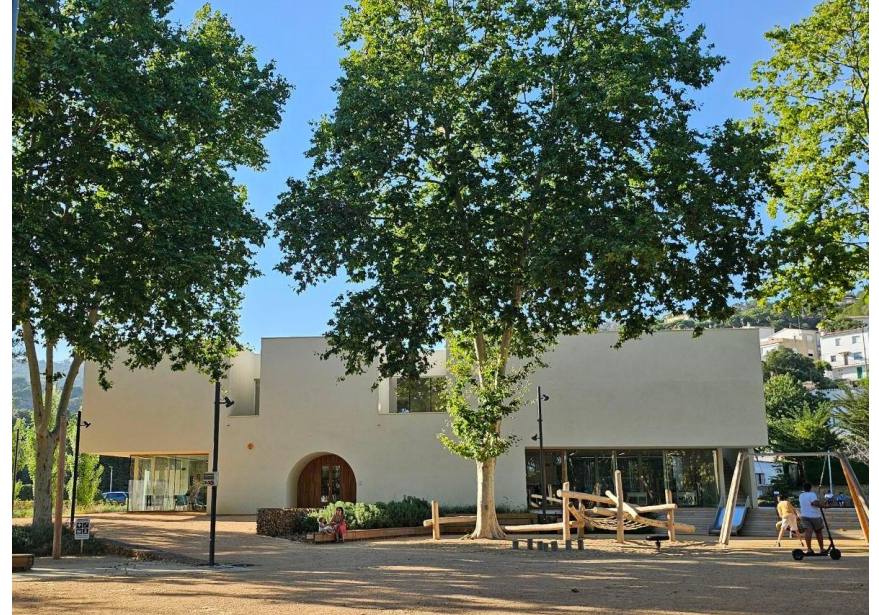
Espai Escoles Velles Castell d'Aro