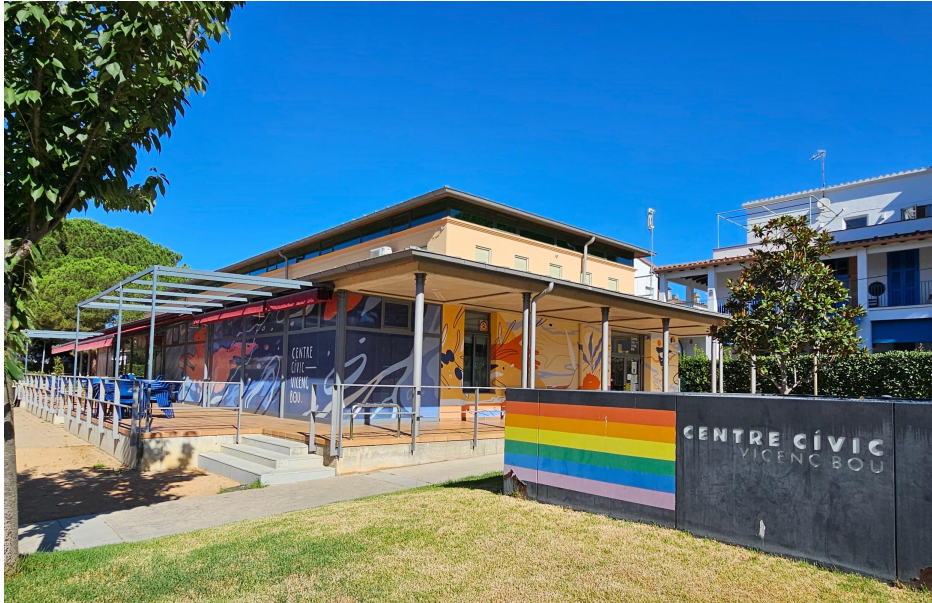
Centre Cívic Vicenç Bou Platja d'Aro