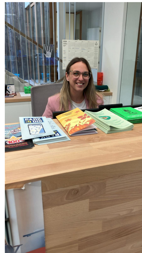
Espai Escoles Velles - Castell d'Aro