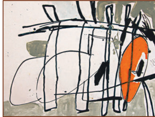
Xavier Ceerre · "Blue Suite #3" · 2017 Tècnica mixta sobre paper · 45,7 x 61 cm

IMATGE COBERTA Jordi Fulla Le Bord Intime Des Nauges · 2011 Tècnica mixta sobre tela · 100 x 100 cm