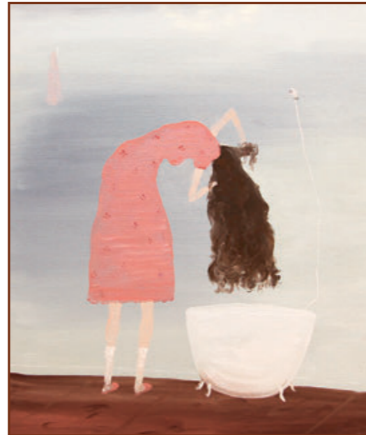
Jose Bonell · 2021 Oli sobre tela · 55 x 46 cm