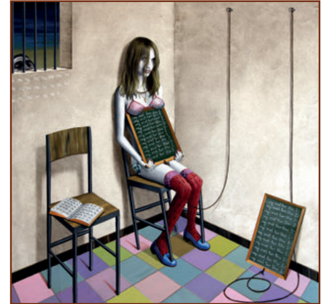
Gino Rubert · "I will not love you" · 2011 Tècnica mixta sobre tela · 100 x 100 cm

Weekends and public holidays 11 am-1 pm and 5 pm-8 pm Easter special: from April 3 to 6 5 pm-8 pm