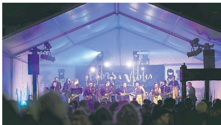
FESTIVAL FLORS I VIOLES