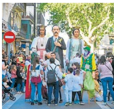
AJUNTAMENT DE FIGUERES