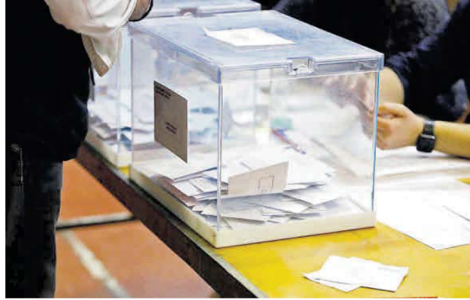
Una mesa electoral de Girona, durant les votacions de les municipals de 2019.

Pel que fa a ERC, té guanyades d'entrada quinze alcaldies més: Tortellà, Cabanelles, Cantallops, El Far d'Empordà, Espolla, Fortià, Garriguella, Ordís, Sant Llorenç de la Muga, Vilamacolum, Bàscara, Camós, Madremanya, Crúlles i Llanars. En alguns casos es presenta amb les seves pròpies sigles, mentre que algunes llistes són de marca blanca, Acord Mu-