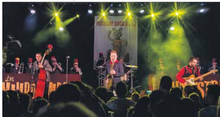
Los Mambo Jambo Arkestra, dissabte en el FestiSurf