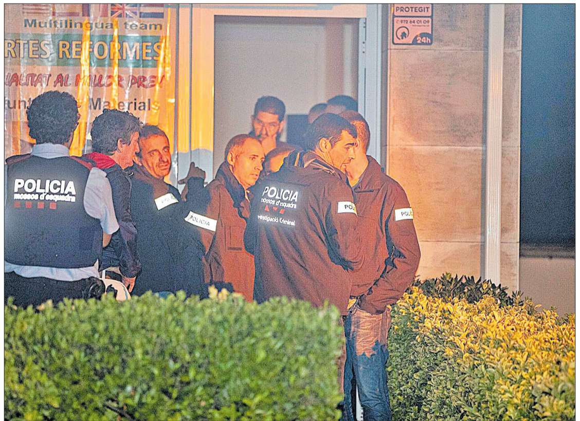
Efectius del rescat de la víctima ofegada en els baixos d'un local de Platja d'Aro, dissabte.