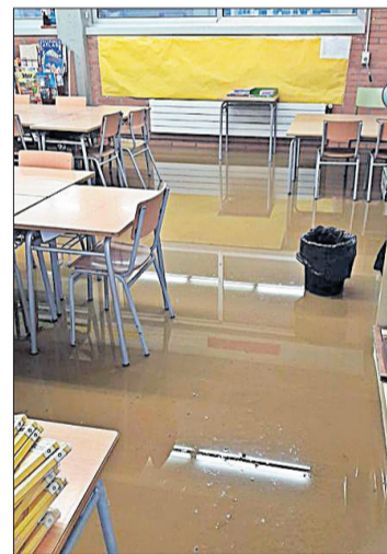
Una de les aules afectades.

■ L'episodi de pluges va produir incidències a l'escola Els Grecs de Roses, que ahir no va poder realitzar amb normalitat les activitats a diverses aules. Les aules de cycle infantil, dues de cycle mitjà així com el gimnàs i el menjador es van inundar i no van poder utilitzar-se durant la jornada d'ahir i es van haver d'utilitzar altres espais