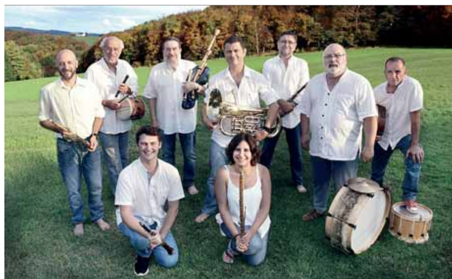
Mini-Stress, en la seva primera imatge oficial