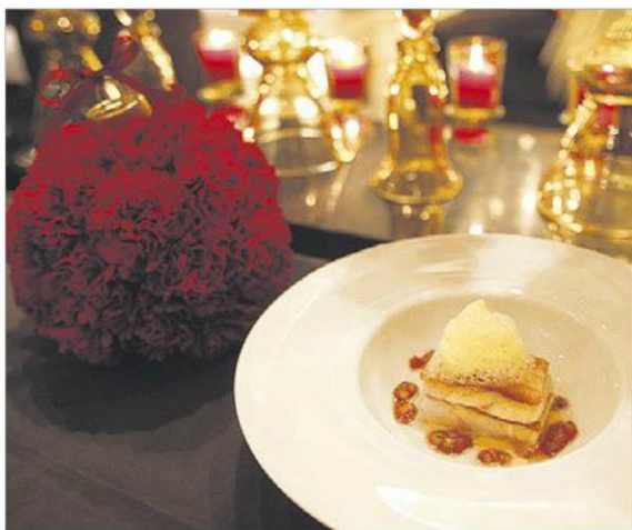
► El Nadal sol convertir els comensals en autèntics gurmets.

EL BESUC / També el Pare Noel intervé directament en la nostra taula nadalenca. Però com que la seva màgia és menor, la seva activitat s'ha reduït a un regal que afecta el besuc, el peix més habitual en el menú de la Nit de Nadal, entès a la castellana. Són en total 25 tones de besuc que poden capturar-se al Gran Sol, si el temps ho permet, i que donaran vida comercial al sector pesquer. No a tot,