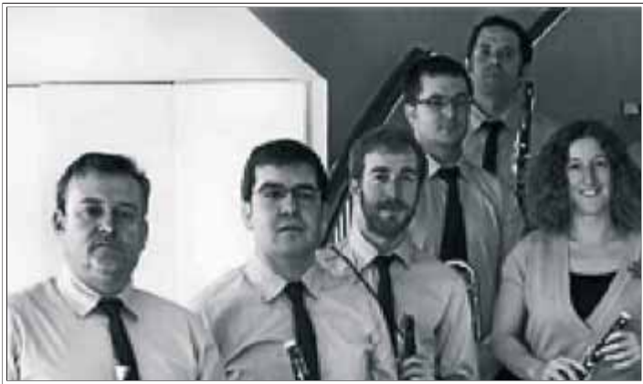
La cobla Marinada és un exemple de renovació del món de la cobla MARINADA