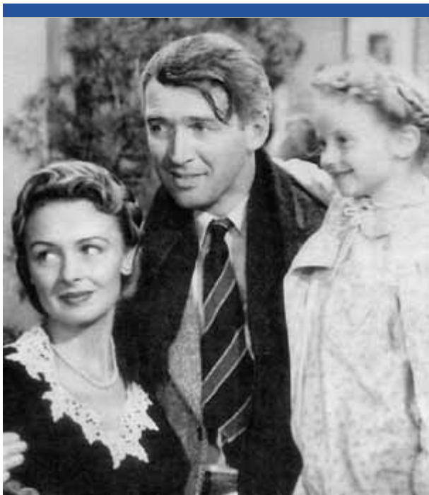
Una escena de la pel·lícula

► 20.30. Església. Concert de Nadal a càrrec de la coral de la Vall d'Aro.