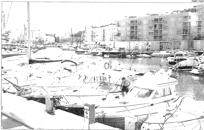
Instal·lacions actuals del Port d'Aro de Platja d'Aro.

El batlle de Platja d'Aro ha concretat que les dues parts (Ajuntament i promotors de l'ampliació del Port d'Aro) s'han de posar d'acord amb la quantia econòmica que els promotors de l'obra aportaran per finançar la passera. En