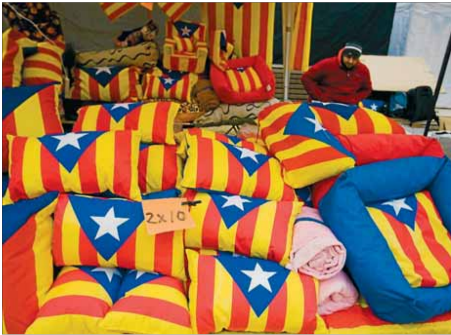
Durant el festival multicultural hi haurà un mercat ■ LLUÍS SERRAT

La jornada divulgativa començarà al matí –cap a les deu– amb una Volada d'Estels Gegants, a càrrec del Club d'Estels Barcelona, mentre que a la tarda hi haurà la Volada de Paramotors amb sortida i arribada a la platja. Tant dissabte com diumenge hi haurà un mercat amb parades de productes de la terra. Durant tota la jornada de dissabte s'exhibirà un autèntic bus anglès que