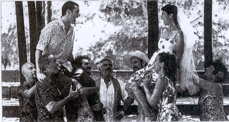
► La companyia Paking Shakespeare, en la presentació de l'obra teatral 'Molt soroll per res'.

La companyia Parking Shakespeare porta l'insigne dramaturg anglès al parc de l'Estació del Nord amb 15 representacions gratuïtes de 'Molt soroll per res'.