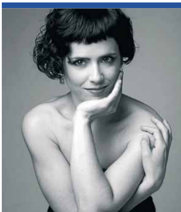
Laia Frigolé ■ ARXIU

▶ 22.00. Plaça Catalunya. Nit de la Sardana. Doble audició amb les cobles Genisenca i Foment del Montgrí.