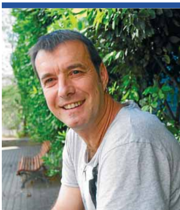
Cris Juanico