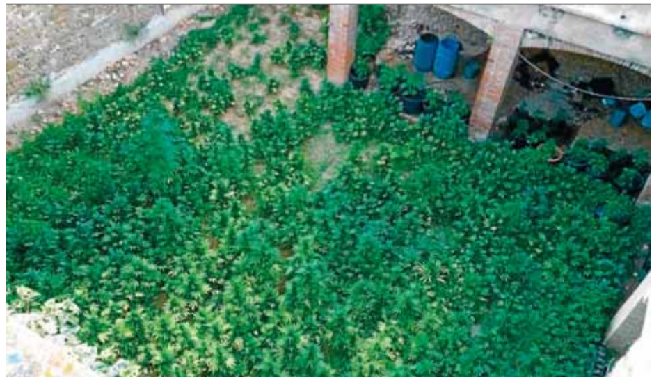
Vuit-centes cinquanta plantes de marihuana van ser intervingudes en un pati ■ CME

Una dotació de paisà va localitzar un vehicle, a l'àrea de servei de Garrigàs, en el qual hi havia dos ocupants amb actitud vigilant i nerviosa. En l'escorcoll de l'automòbil van trobar 1,35 quilos de marihuana i 5,72 d'haixix. Durant la inspecció, un tercer home es va acostar al cotxe i va manifestar que n'era el conductor i el propietari. Va quedar detingut, ja que va afirmar que la droga era seva. Segons l'Oficina Central Nacional d'Estupefaents, les substàncies intervingudes estarien valorades en uns 1.400 euros. L'acusat va passar el dia 15 a disposició del jutjat de guàrdia de Figueres, que va decre-