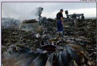
Les restes de l'avió.

Kíev i els rebels s'acusen d'abatre un avió amb 295 passatgers a Ucraïna