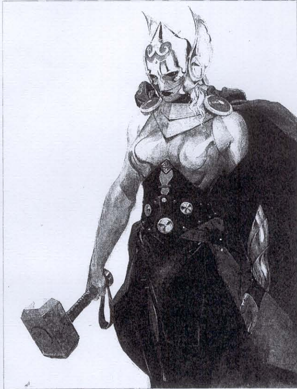
► A l'esquerra, el Capità Amèrica, el nou superheroi de color de Marvel. Al seu costat, Thor, la deessa del tro, que empenya el martell Mjolnir.