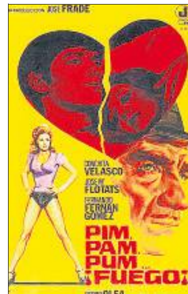
El cartell de la pel·lícula