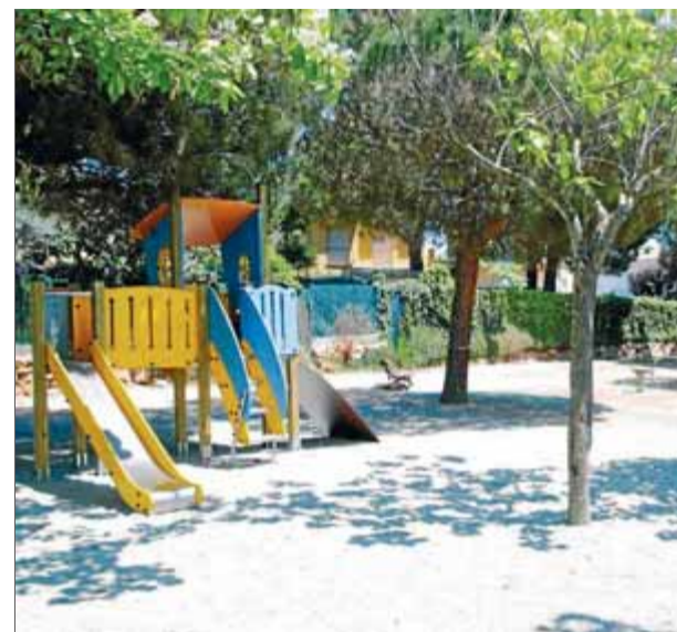
El parc de la Urbanització Dalmau, on els veïns volen canvis