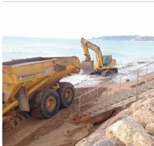
Un camió porta sorra i una retroexcavadora l'escampa

El servei de Costes ha estat fent també treballs de condicionament i millora de les platges de Sant Antoni, Torre Valentina i Es Monestri, al municipi de Calonge. Les feines han