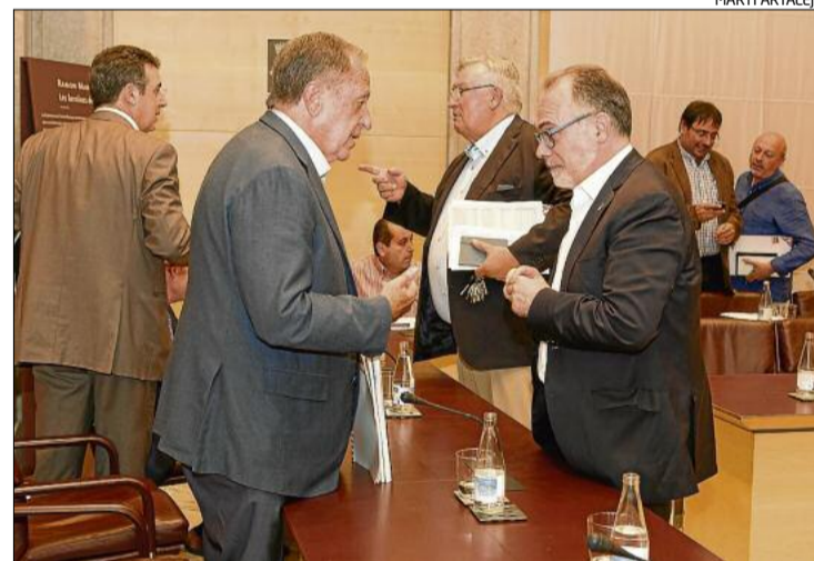
La Diputació va celebrar el que ha de ser l'últim ple del mandat

Segons Giraut, el futur de la Diputació de Girona es decidirà d'acord amb els resultats de les eleccions municipals del 24 de maig, els pactes que hi ha entre CDC i UDC i el parer de la cúpula dels dos partits. Com ja va ex-