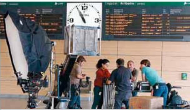
Una part de l'equip de rodatge, ahir a l'estació ■ LL. SERRAT