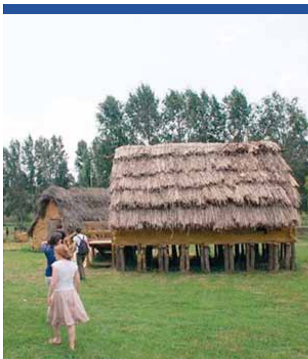
El parc de la Draga

► Jornades gastronòmiques amb els Tastets surrealistes, als restaurants de la ciutat. Fins al 11 de juliol.