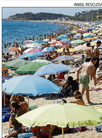
Platja d'Aro, ahir al matí.