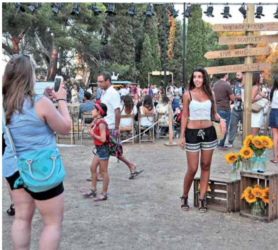
Desfilades, música i parades de moda eren els atractius de la mostra ■ JOAN SABATER

Al mercat hi ha hagut la presència d'un total de 32 marques de nous dissenyadors. S'hi podien comprar des de complements de Cuadecuc, camises de Batabasta fetes amb teixit de Shangai, roba surfer de Docbord, bosses Rowdy o elements de decoració de I Believe in Dreams.