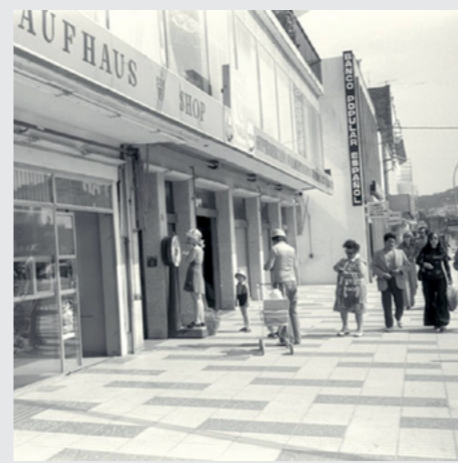
Pablito. INSPAI, Centre de la Imatge, Diputació de Girona

También con frecuencia los coches abandonan su dominio y el asfalto y las amplias aceras se convierten en el escenario para celebrar multitud de eventos: ferias, carreras, actuaciones musicales y, por supuesto, el gran desfile de carrozas y comparsas del Carnaval. El fotógrafo de prensa Pablo García Cortés Pablito (1922-1999) retrató durante muchos años el boom turístico de la Costa Brava, con imágenes de personalidades, artistas y famosos de todo el mundo para Los Sitios/Diari de Girona , L'Indépendant , Tele-Express o las agencias EFE y Europa Press . Su legado se convierte en testigo de toda una época.