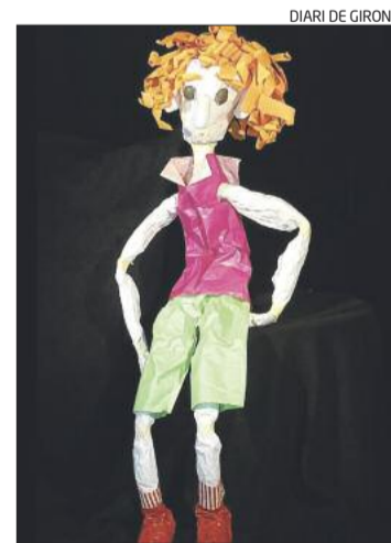
Una titella de paper de l'espectacle.

L'espectacle consta de quatre contes: «El canó de la pau», que narra la història de dos països en guerra i un canó que sona a pau; «Pepo-paper», basat en la «hipòtesi fantàstica» ¿què passaria si... et trobares un xiquet de paper?;