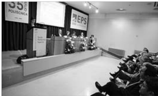
Una inauguració de curs a l'Escola Politècnica Superior de la UdG, en una imatge d'arxiu