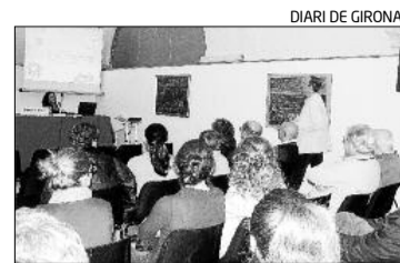
Els assistents a la conferència.

El mes de maig de l'any passat, i fruit d'un conveni signat entre l'Ajuntament de Palamós i el Consell Comarcal del Baix Empordà, es va posar en funcionament el Servei Municipal d'Habitatge de Palamós, que es troba ubicat a les dependències del Punt Jove (c/ de Sta. Marta, 6) realitzant l'atenció al públic, tots els dilluns (laborables) de 10 a 14 h. L'objectiu és poder atendre de primera mà als ciutadans en aquesta matèria i poder-los aconsellar.