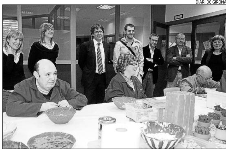
DIARI DE GIRONA

Saben que des de 2004 hi ha hagut al Japó 6 primers ministres diferents (Koizumi, Abe, Fukuda, Aso, Hatoyama i Kan) i que no han tingut cap inconvenient a renunciar o a dimitir quan no s'han vist en cor de fer-ho millor? Com aquí, vaja. Vostès ja veuen per on vaig.