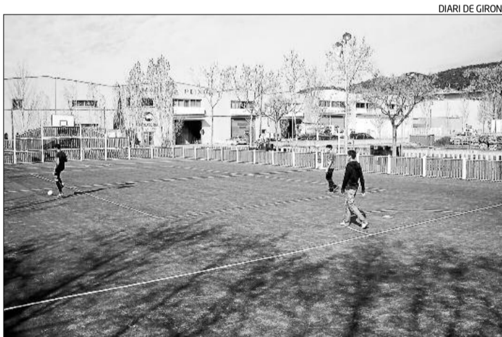
Una de les pistes multiesportives inaugurades dissabte passat.

s'han edificat a la població incloplint les normes urbanístiques.