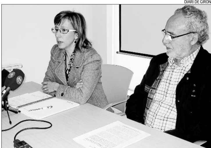
L'alcalde de Palamós i el regidor d'Urbanisme en la presentació del Pla.

El procés de redacció del Pla Local d'Habitatge de Palamós s'ha nodrit de les entrevistes practicades a diferents immobiliàries, constructores, promotors, representants d'entitats bancàries i fi-