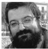
EL NAS DE LA BRUIXA