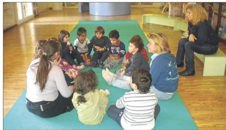
A la fotografia de dalt, els set mestres de l'escola Pericot que han viatjat a Itàlia. A baix, una classe de ioga a l'escola La Ginestra.

tors d'Educació infantil i la mestra d'anglès; el mateix nombre de persones que les delegacions d'Alemanya i Istanbul.