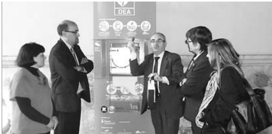
Un aparell de mostra ubicat ahir al costat de l'entrada de l'ajuntament