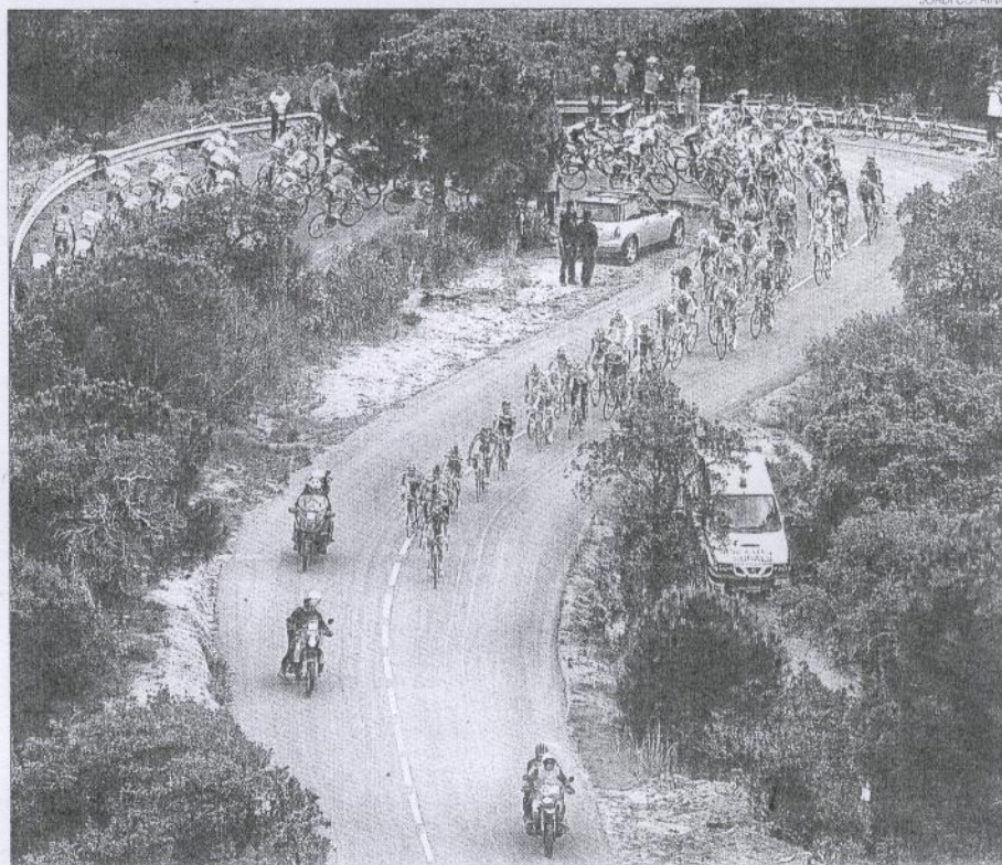
► El gran grup de la Volta recorre els revolts de la pujada a l'Alt de Sant Grau, camí de Tossa de Mar.