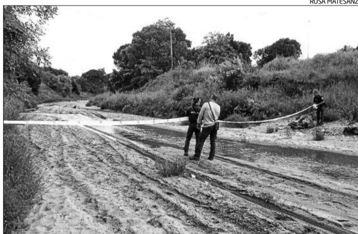
Els rurals marcant on hi havia nius, amb roderes a la llera.

guretat, que van anar clavant a les parets superiors de la gruta, per anar-se endinsant a la cova. A dins, el fang i els sediments en complicaven la visibilitat. «La hipòtesi més probable és que, un cop el submarinista es va endinsar dins la cova i ja tenia el peix punxat, com que es va moure tanta brutícia no va poder trobar la sortida», va dir Cifuentes.