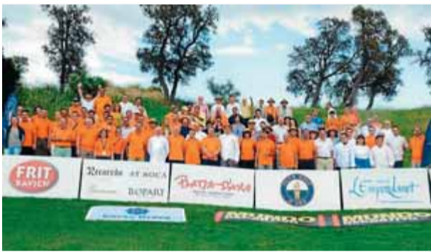
GRUP COSTA BRAVA CENTRE

per posar fi a l'actual situació d'impagament. La formació també ha fet una crida a solidaritzar-se amb les treballadores, que han engegat una campanya de recollida d'aliments per fer front a la vaga. La formació també ha demanat a l'Ajuntament de Girona que s'impliqui en el cas per tal d'assegurar que les treballadores cobrin la quantitat que se'ls deu de manera urgent. La CUP també va anunciar que portarà el cas al Parlament. ■ REDACCIÓ