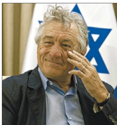
►► Robert De Niro.

anys. L'artista, que és jueva, havia visitat Israel altres vegades, però mai per fer-hi concerts. En aquesta ocasió delectarà el públic amb un parell d'actuacions a Tel Aviv i ahir en la festa ja va deixar sentir la seva veu, qualificada de «celestial» per Peres , al cantar-li un parell de cançons al president, una d'elles en hebreu.