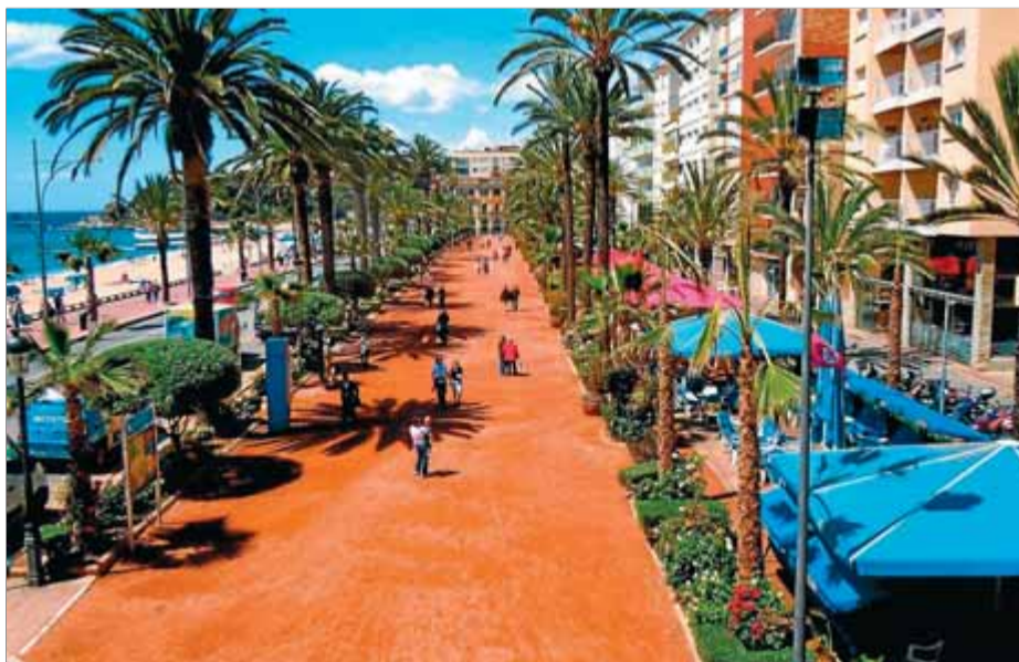
El passeig Verdaguer , on els comerciants volen que es faci el mercat de marxants ■ EL PUNT

L'associació –que de fet ja havia reivindicat aquest mercat en el passat, i en les passades eleccions va fer arribar la proposta als grups municipals– entén que aquesta iniciativa ajudaria a dinamitzar en l'època de baixa temporal l'eix de carrers Sant Romà, Vila i Venècia, afectant els carrers adjacents, així com bona part del centre de la població d'acord a uns paràmetres d'implantació i un temps concret. Per fer aquest informe s'han analitzat els sectors