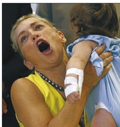
►► Sharon Stone.

L'infatigable Peres , de qui diuen que és immortal perquè fa dècades que està en la política israeliana, va quedar eclipsat per Streisand , que actuarà a Israel per primer cop als 71