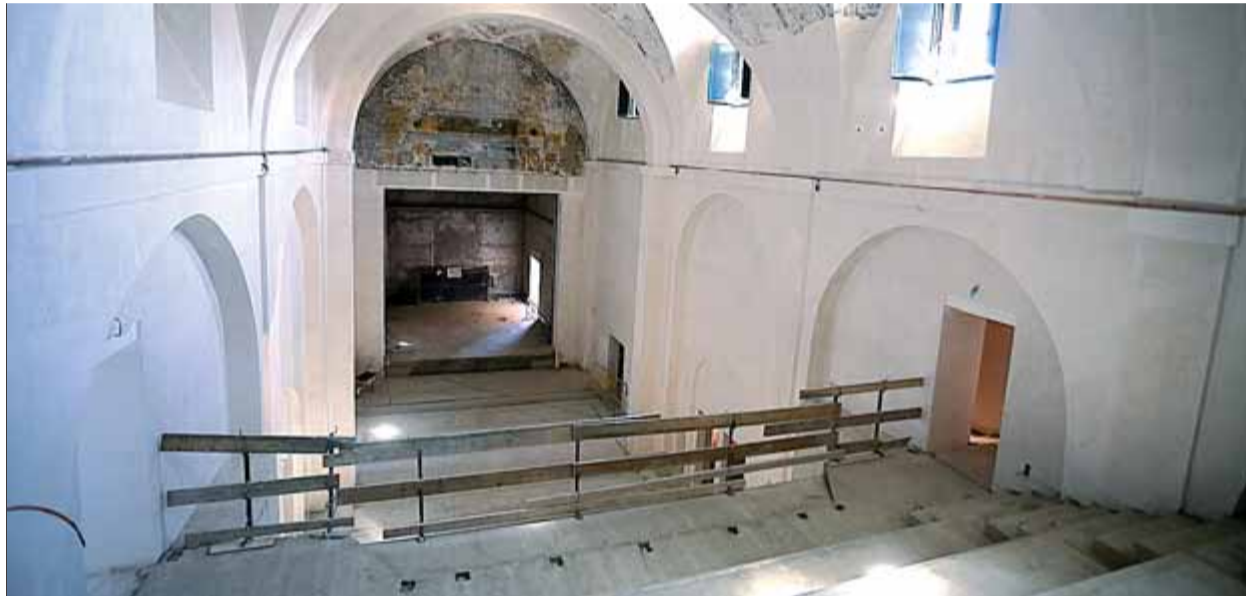
L'antic convent dels Caputxins un cop va acabar la primera fase de les obres

La rehabilitació d'aquest edifici del segle XVIII ha estat una de les prioritats del govern municipal, de CiU, juntament amb l'antic escorxador i la Catequística. El convent el van construir