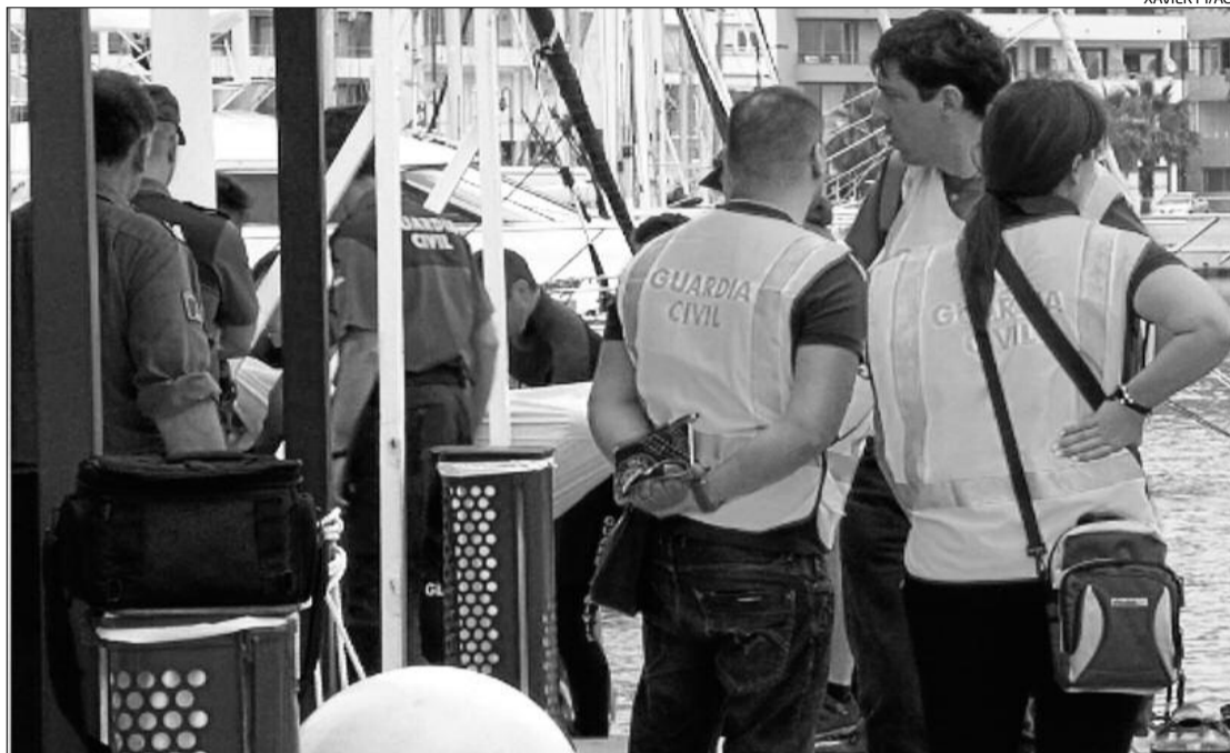
Els agents de la Guàrdia Civil, en el moment de fer l'aixecament del cadàver al port de l'Estartit.

El cos es trobava dins d'una cavitat que forma la cova submarina (a uns 18 metres de profunditat), a uns cinc metres de distància on dilluns es va trobar el seu fusell de pesca. Els espeleòlegs vinguts de diferents punts d'Espanya van localitzar el cos pels voltants de les dotze del migdia, després d'entrar a la gruta ajudats per un fil de se-