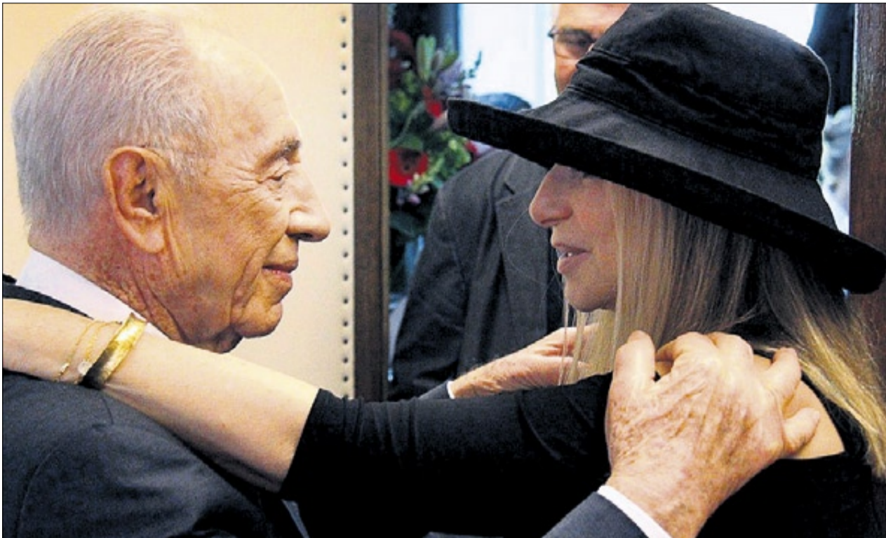
►► Shimon Peres i Barbra Streisand s'abracen, dilluns a la nit, a Jerusalem.