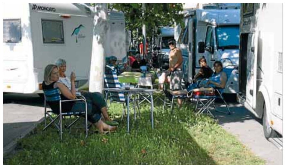
Alguns participants en la trobada d'autocaravanistes d'aquest cap de setmana a les Ribes del Ter, a Girona

A banda de les àrees en servei i de la que es podria materialitzar aquest any a Girona, a les comarques gironines hi ha el cas particular de l'aparcament d'autocaravanes de Platja