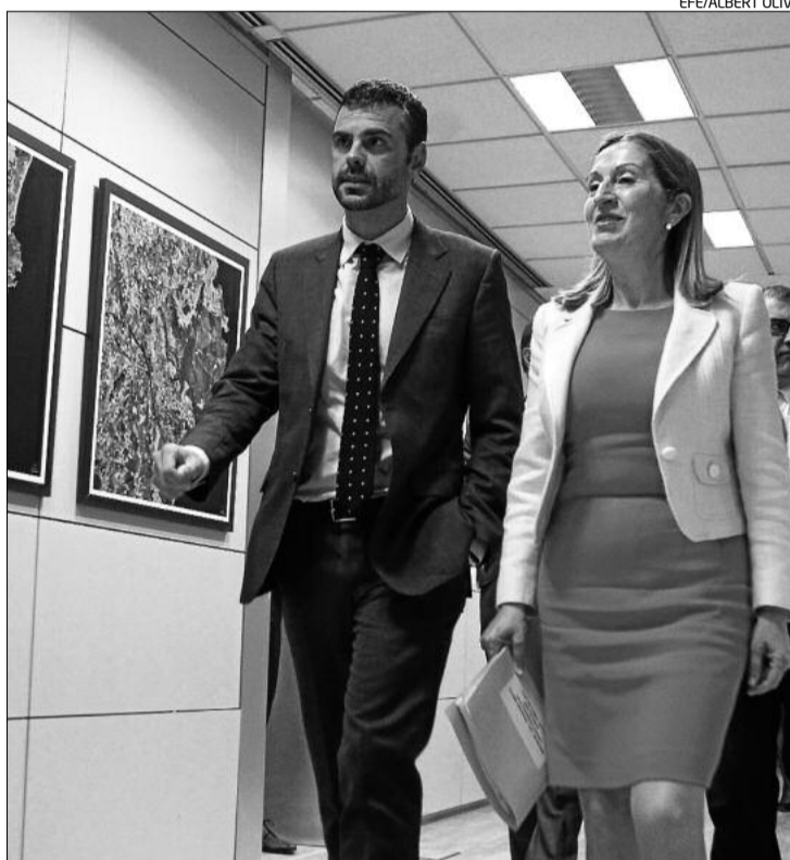
El conseller Vila i la ministra Pastor es van reunir ahir.

Finalment serà Renfe la que segueixi gestionant el servei de Rodalies fins a 2015. A partir d'a-