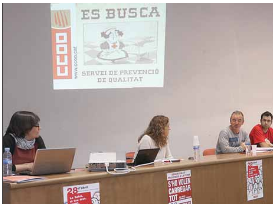
La reunió de delegats de CCOO a Girona per tractar de salut laboral

El sindicat demana una intervenció política en un cas que afecta no només 134 treballadors, sinó també, hi afegeix, un territori. “Torraspapel ha estat una empresa que ha obtingut enormes beneficis al llarg dels anys i aquests beneficis han estat a costa del treball de les persones, però també a costa de l’en-