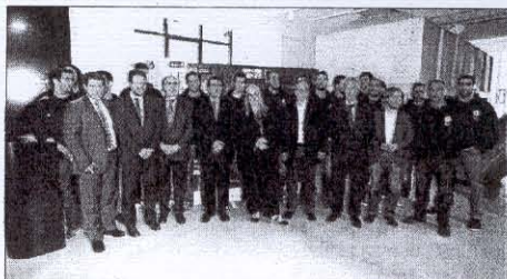
Una imatge de la presentació de la Final Six europea