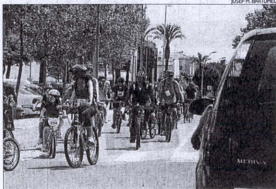
Un moment de la cursa pels carrers de Platja d'Aro

Tampoc entén com l'Ajuntament li va aprovar el projecte i li va donar la llicència, i fa cosa d'un mes i mig li van requerir l'estudi acústic, el certificat del qual ja va demanar i pagar a finals de març i està pendent que l'hi facin. Amb aquesta situació, creu que abans del precinte, la policia li hauria d'haver fet una prova ja que «un bar sense televisor ni música és com un bar sense cafeteria», cosa que creu que li pot suposar pèrdues econòmiques.