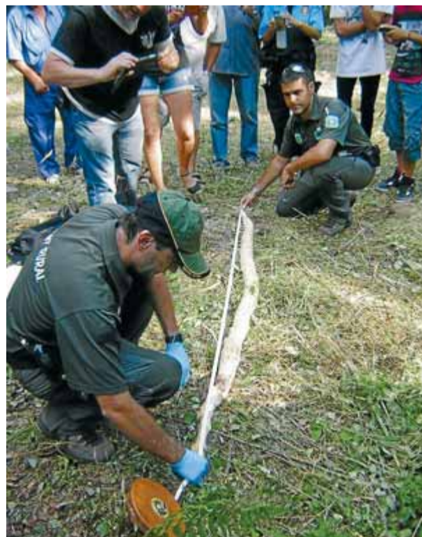
La serp pitó de Riells és inspeccionada per agents rurals, enmig d'un munt de curiosos

La serp, a Torreferrussa Els serveis municipals es van posar en contacte amb els agents rurals, que van recollir i traslladar l'exemplar al Centre de Recuperació de Fauna Salvatge de Torreferrussa. Els agents rurals, juntament amb una bona colla de veïns, la brigada municipal i els vigilants municipals, havien estat buscant la serp, que feia 2,36 metres i pesava 5 quilos, durant els vuit dies que va estar desapareguda. ■