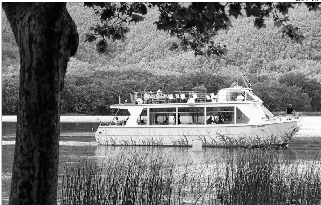
La «Tirona», ahir, fent un dels seus recorreguts per l'estany de Banyoles.

Segons Guillén, els passeigs en barca per l'estany estan perdent l'estigma patit després del naufragi de l'Oca, el 1998. «Tot això ja es