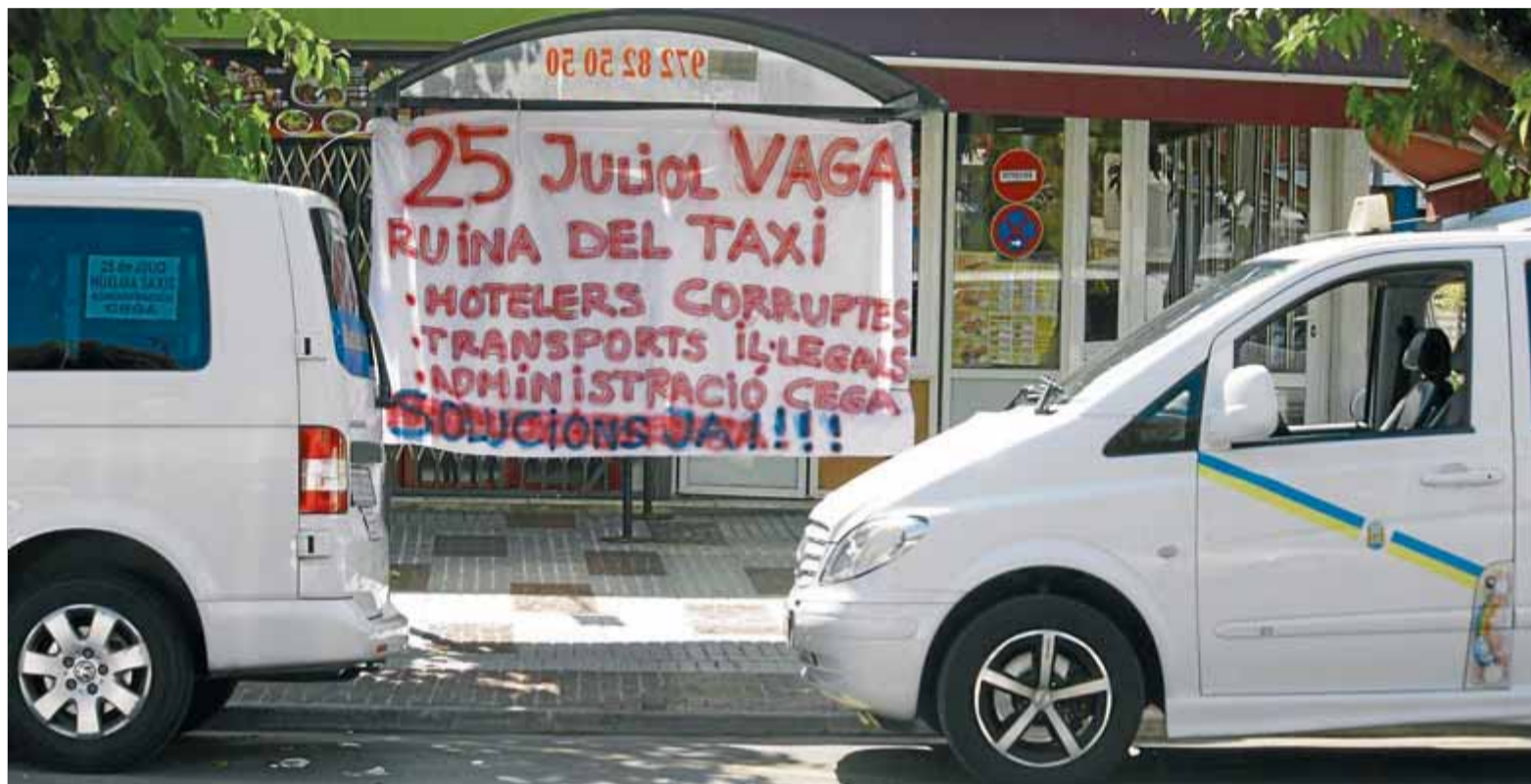
Parada de taxis del carrer del Cavall Bernat de Platja d'Aro

■ L'Associació de Taxistes Autònoms es va reunir amb l'Ajuntament i amb Transports i va entendre que ja hi ha control ■ És el segon cop que la vaga es desconvoca dies abans de fer-se