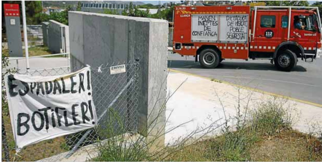
Un dels vehicles del parc de bombers de Llançà, on hi ha penjada una pancarta en contra del conseller d'Interior