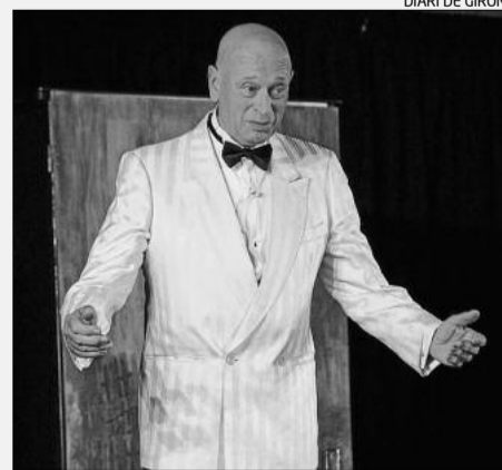
El mag Xevi, en una edició anterior.

El Festival se celebrarà a la sala polivalent de l'Es-