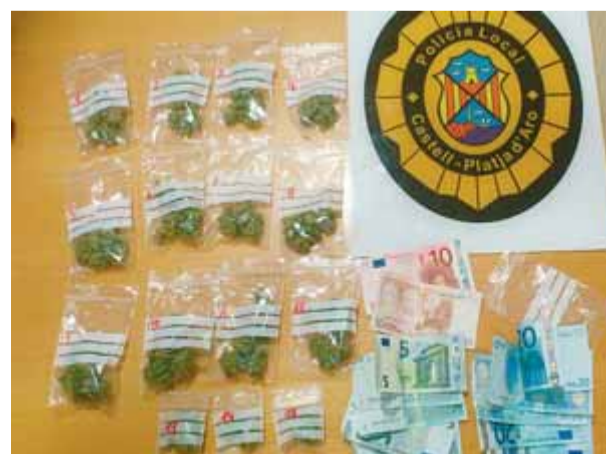
Bossetes de plàstic i bitllets intervinguts en l'actuació policial

de deu euros. Davant d'aquests fets, la policia hi va intervenir i va identificar el jove marroquí, a qui li va intervenir 15 bosses amb marihuana i 245 euros. Per aquest motiu, es va detenir el traficant per un presumpte delictes contra la salut pública. ■