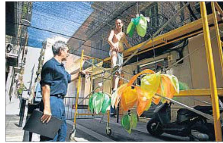
Un bomber passa revista als treballs al carrer Berga