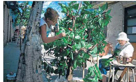
Unes veïnes de Fraternitat preparen arbres d'horta