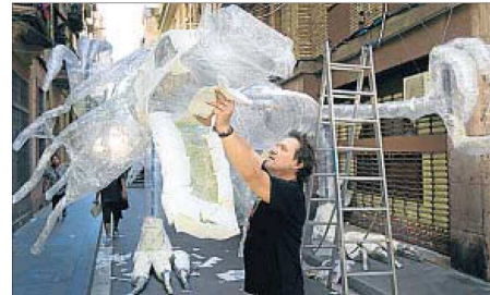
Un veí treballa en l'elaboració d'un drac a Llibertat