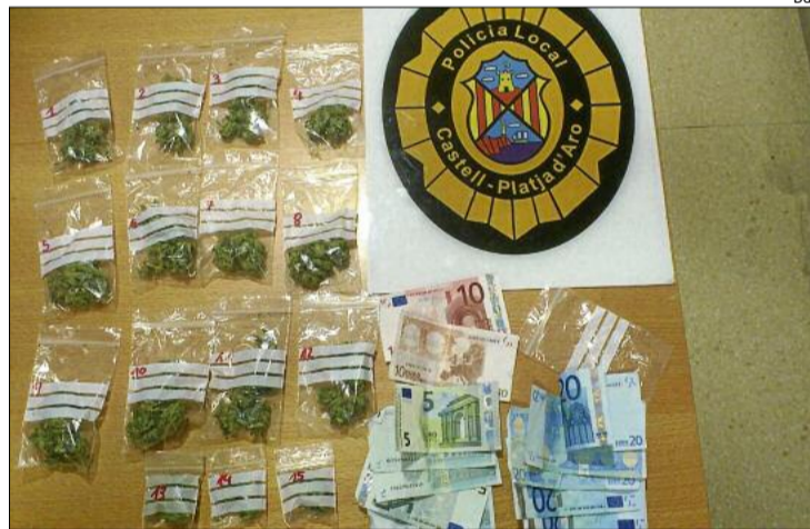
Les bosses de plàstic amb l'herba i els bitllets intervinguts al detingut.

■ La Policia Local de Castell-Platja d'Aro va detenir la nit del passat dissabte una persona per un presumpte delictes contra la salut pública per tràfic de drogues. El detingut és un jove de nacionalitat marroquina, Youssef A., de 26 anys. Els agents de policia estaven realitzant tasques de vigilància quan van observar com dos joves estrangers iniciaven una conversa amb el detingut, que els indicava amb gestos que anessin cap a la platja.