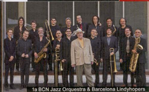
1a BCN Jazz Orquestra &amp; Barcelona Lindyhoppers