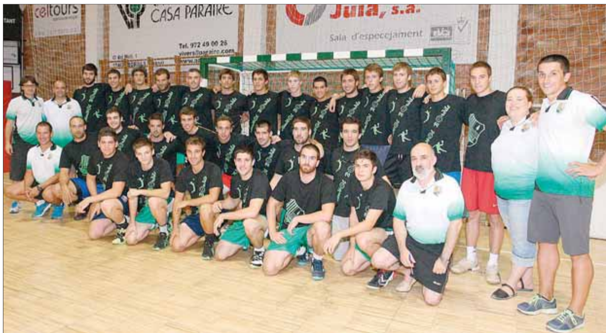
La plantilla del Bordils, ahir, en la primera sessió d'entrenament de la pretemporada ■ LLUÍS SERRAT

16a Travessia Nerdant de Platja d'Aro. El Club Natació Riemba organitza l'11 de setembre la setzena edició de la Travessia Nerdant de Platja d'Aro, amb una distància de 1.900 metres amb sortida de la platja de Racó de s'Agaró i arribada a la platja sa Conca. ■ EL 9