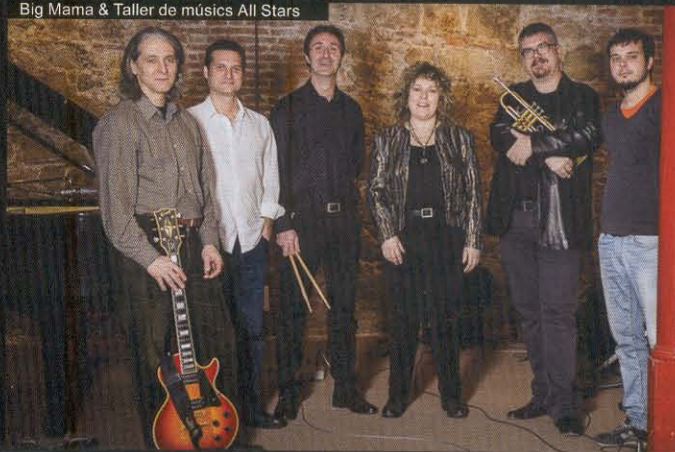
Big Mama & Taller de músics All Stars

L a setzena edició de les Nits de Jazz de Platja d'Aro és una de les activitats d'estiu més fresques, dinàmiques, de qualitat i amb èxit de públic a la Costa Brava.