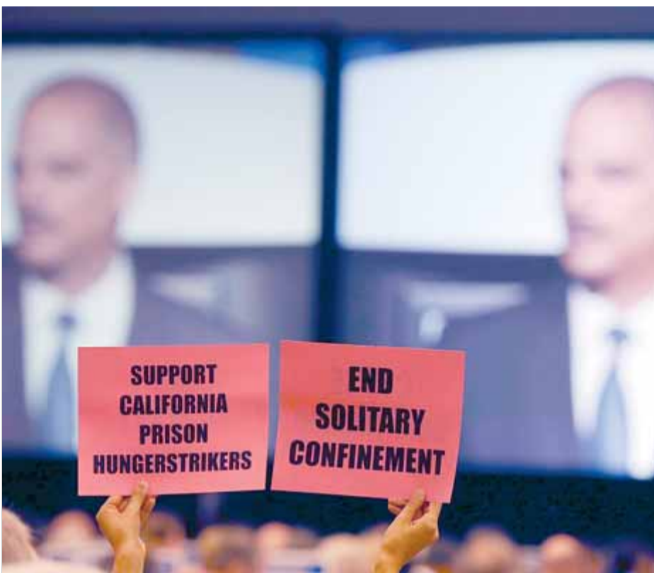
Una dona protesta mentre el fiscal general dels EUA explica la reforma