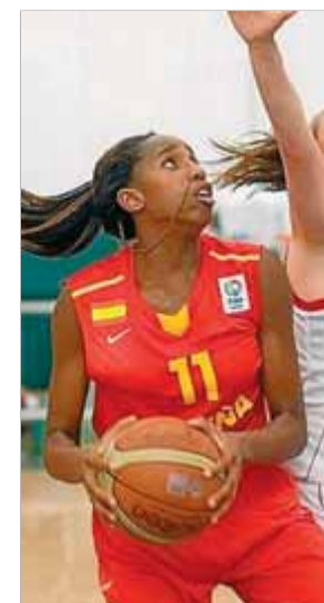
López ■ FIBAEUROPE

de l'època del Santa Eugènia. Aleshores i durant el torneig, excel·lint i multiplicant-se en les tasques defensives i en el rebot. En l'europeu ha estat la quarta millor en rebots (11,1) i la tercera en taps (1,9). ■