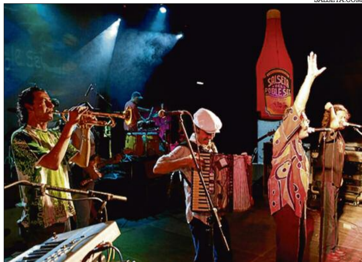
La Salseta del Poble Sec actua dimecres 14 a la plaça del Mil·lenari.