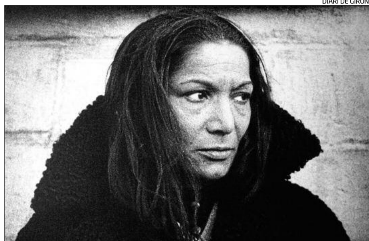
La «bailaora» Carmen Amaya.