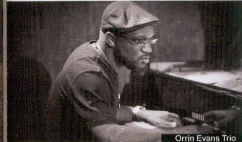
Orrin Evans Trio

Tots els concerts seran a partir de les 23h. de la nit a la Platja Gran de Platja d'Aro.