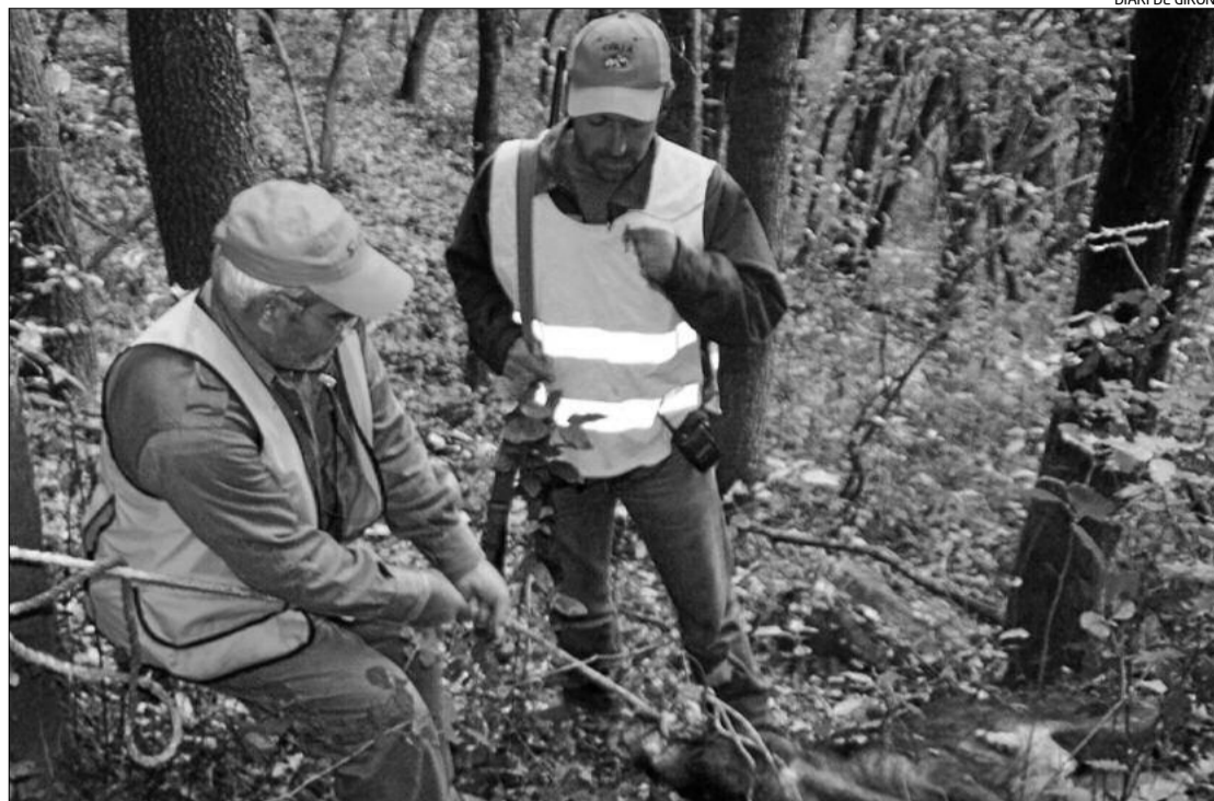
Un caçador arrossega un senglar abatut en una cacera efectuada la temporada passada.

Des del Parc, aconsellen no donar-los menjar i evitar els encreuaments amb els porcs domèstics, perquè els efectes d'aquestes pràc-