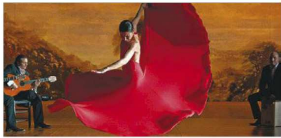
►► La 'bailaora' gaditana Sara Baras durant l'espectacle 'La Pepa'.