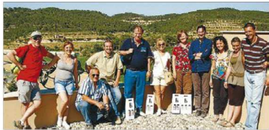
►► Els assistents a l'última edició de 'Clotxa & Wine & Walk'.

Proposta: localitats per a La Pepa , de Sara Baras. Preu: 25% de descompte per als socis del TR3SC. Dates: divendres 16 d'agost, a les 22.00 h. Espai: Palau d'Esports i Congressos (pl. d'Europa, s/n, Platja d'Aro). Participació: a www.ticketmaster.es .