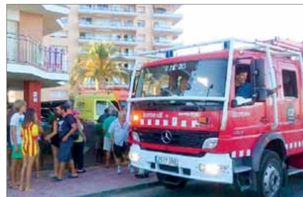
Els bombers i l'ambulància del SEM a l'edifici Kensington de Sant Antoni, on van tenir lloc els fets ■ MARC SALGAS