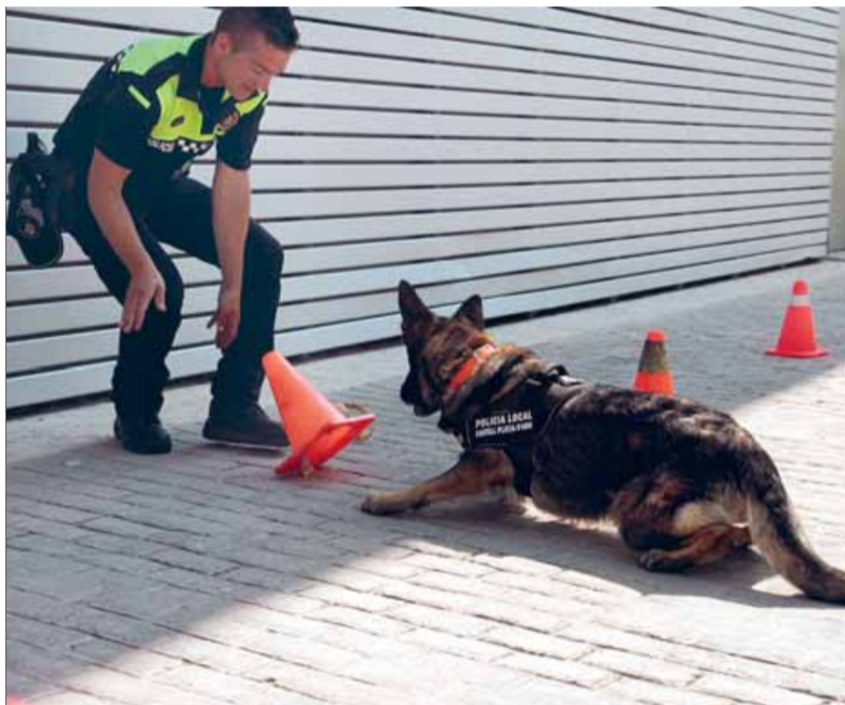
La Mia és una pastor alemany de quatre anys que forma part de la nova unitat K-9 de la policia local de Castell-Platja d'Aro ■ E.A.

L'home, de 37 anys i de nacionalitat marroquina, va ser denunciat per tinença il·lícita de drogues. Al cap d'uns minuts, i molt a prop, el gos ensinistrat va fer senyals d'haver detectat substàncies tòxiques en un ciutadà francès, a qui van trobar una bossa de plàstic transparent amb, altre cop, marihuana. El noi va dir que li havia donat un home marroquí, el mateix que moments abans havien denunciat els agents. Un cop donat l'avís, una patrulla va observar una persona