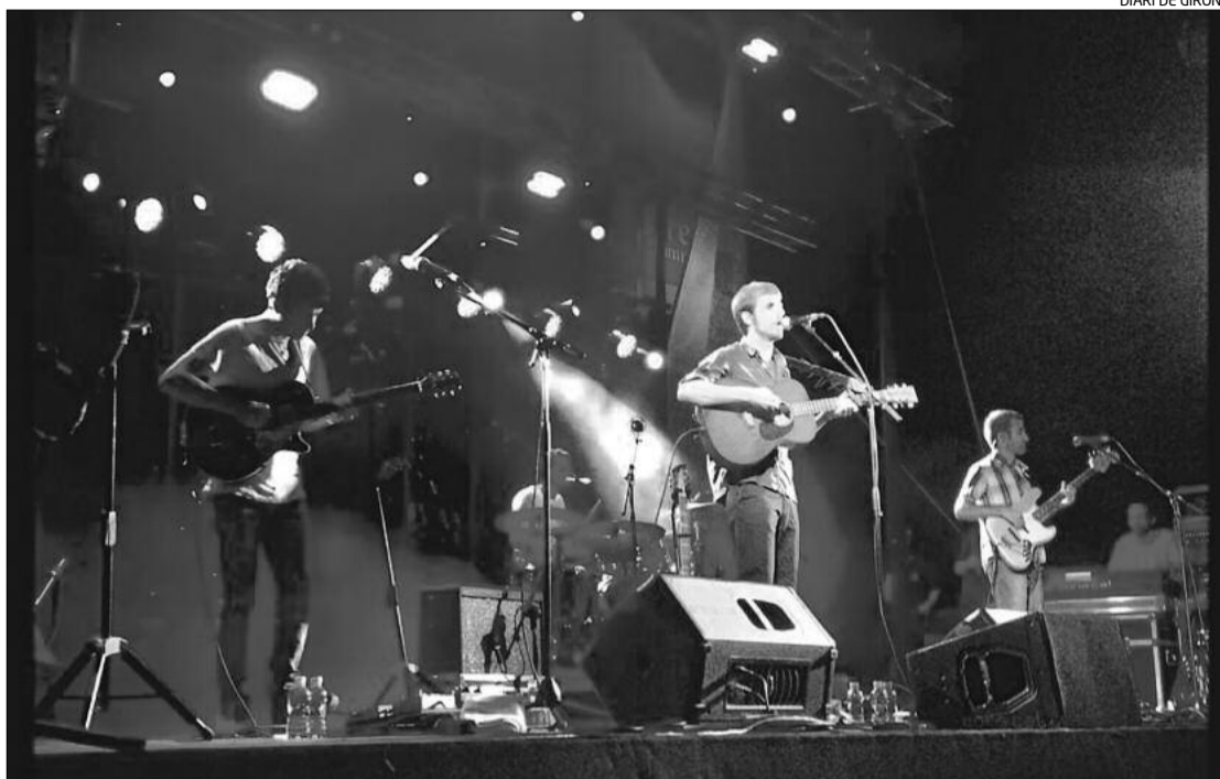
Els Manel van oferir un espectacle sobri però que va entusiasmar el públic de Calonge.

AQUESTA PARELLA, ELS SEUS FILLS I UNS AMICS ESTAN PASSANT DUES SETMANES DE VACANCES AL CÀMPING VALL D'ARO. FAN BÀSICAMENT PLATJA I ESTAN MOLT CONTENTS AMB EL TRACTE REBUT, TOT I QUE ES QUEIXEN QUE A MOLTS LLOCS S'HA DE PAGAR PER APARCAR.