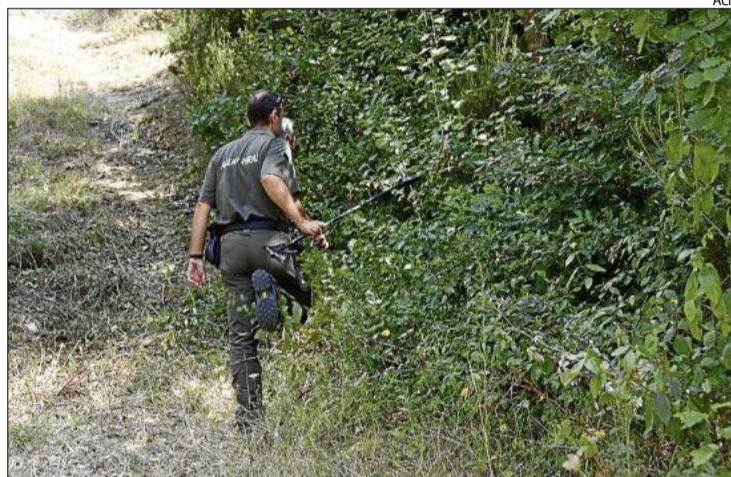
Un grup de tècnics treballant en la recerca del rèptil que es va escapar.

Així, Bagot va assenyalar que les tasques de recerca es dediquen ara «a vigilar a primera hora del matí,